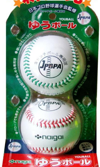
グリーン&レッドの新コンビが誕生しました！

キャッチボールを通じて、家族や友達とのコミュニケーションから、野球の基礎練習まで、ゆうボールをぜひご利用下さい。