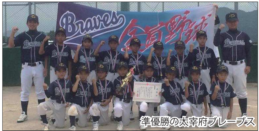
準優勝の太宰府ブレーブス

【日程】8月23日(日)～9月12日(土) 【会場】天拝湖野球場 【出場】14チーム(小学3年生以下) ▽決勝トーナメント(準決勝) 筑紫野リトルホークス11対4大野城少年野球 太宰府ブレーブス5対1筑紫ビッキーズ ▽決勝トーナメント(決勝戦) 筑紫野リトルホークス8対3太宰府ブレーブス