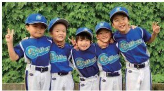
「一緒に野球を楽しもう♪」

・毎週土曜日(10:00～11:30) ・FIBベースボールアカデミー練習場 (博多区西月隈4-919-1)